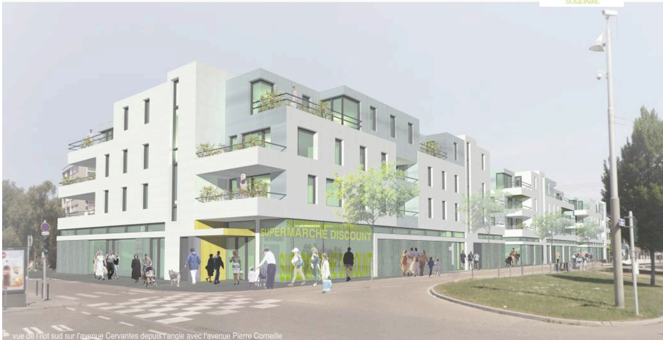
vue de l'ilot sud sur l'avenue Cervantes depuis l'angle avec l'avenue Pierre Corneille

Vue côté Le Maillon (vue non contractuelle)