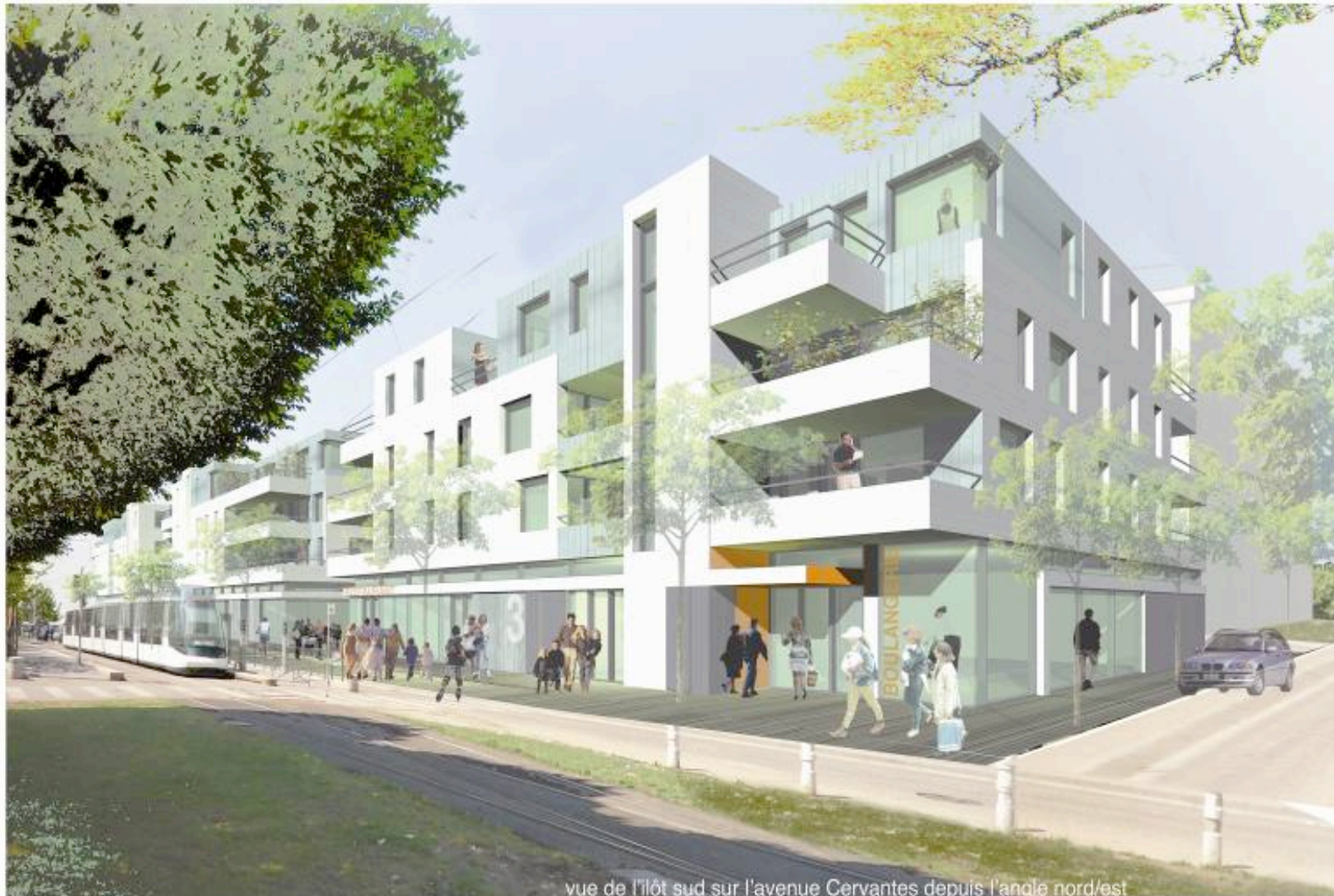
vue de l'îlot sud sur l'avenue Cervantes depuis l'angle nord/est